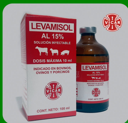
LEVAMISOL AL 15%