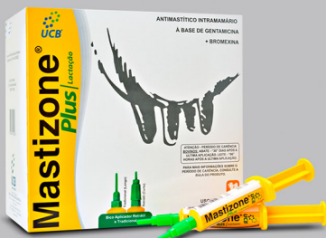
MASTIZONE PLUS LACTACION