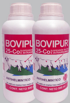
BOVIPUR 25% + CO