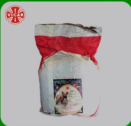
PROMOMIX 40 %