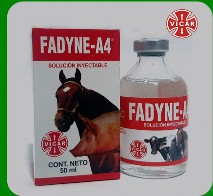
FADYNE - A4