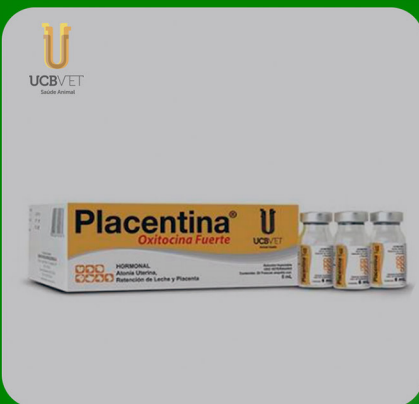
PLACENTINA OXITOCINA FUERTE

Dosis: Fines obstétricos: Vacas y yeguas 7.5 a 10 m; cerdas, ovejas y perras de 3 a 5 ml. Para descenso de leche: Vacas y yeguas 1-2ml, cerdas y ovejas de 0.5-1 ml., perras máximo 0.03 ml. Administración: vía intramuscular o subcutánea. Presentación: 10 ml