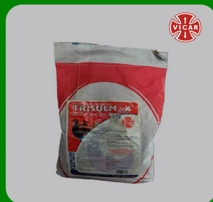
TRISULMIX 1 5%