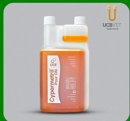
CYPERMETRIL POUR ON