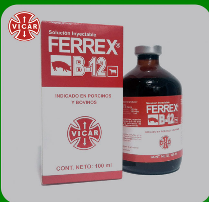
FERREX B-1 2