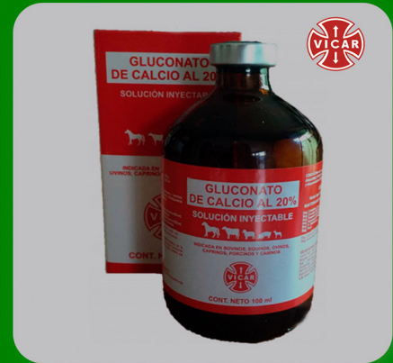
GLUCONATO DE CALCIO. AL 20%