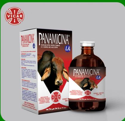
PANAMICINA L.A. 20 %