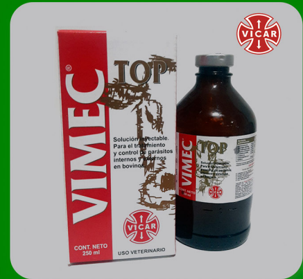
VIMEC TOP 3.15 %