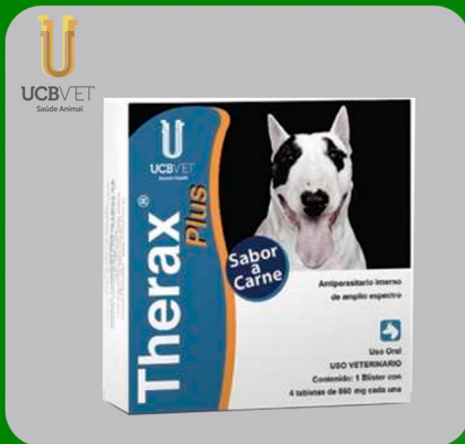
PLATELMIN PLUS THERAX PLUS